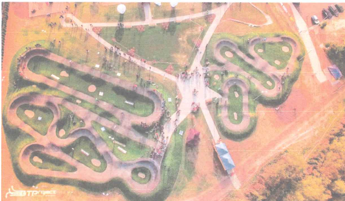
Przykładowa realizacja (Nowy Sącz, Polska)

Obiekt, który sprawia nieustającą radość w pełnym tego słowa znaczeniu, przeznaczony dla średnio zaawansowanych i zaawansowanych użytkowników. Łączy możliwość wykonywania skoków z płynną jazdą na dużych, bezpiecznych zakrętach profilowanych. FLOW TRACK to także niekończąca się zabawa na licznych rozgątzeniach i przeszkodach, które można pokonywać w różnych kierunkach.