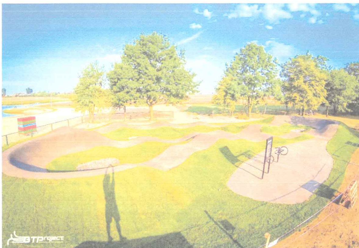
Przykładowa realizacja (Raszków, Polska)

- Pumptrack łączy ludzi i umożliwia współtętnienie w otoczeniu na tolerancji i aktywności.