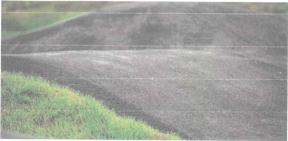
Prawidłowo zagęszczona i wyprofilowana nawierzchnia asfaltowa